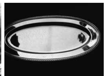
研磨及びメッキ後