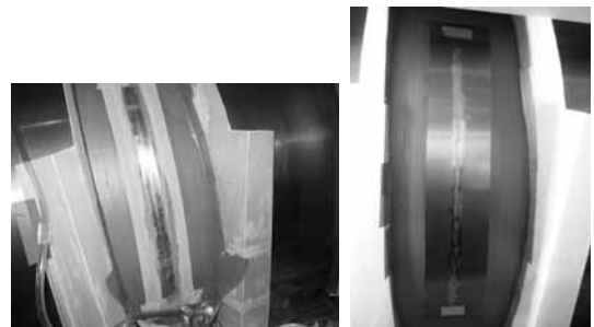
SIFCOプロセスによる大型シリンダーロール補修過程

早速、田口社長は、同社従業員でもある自身のご子息に詳細の調査およびノウハウの習得を指示。この夏にはアメリカへ派遣し、正式にシフコ社の具体的プロセスを習得させることを計画。新規事業として「今年中に本格稼働させたい」と意気込む。